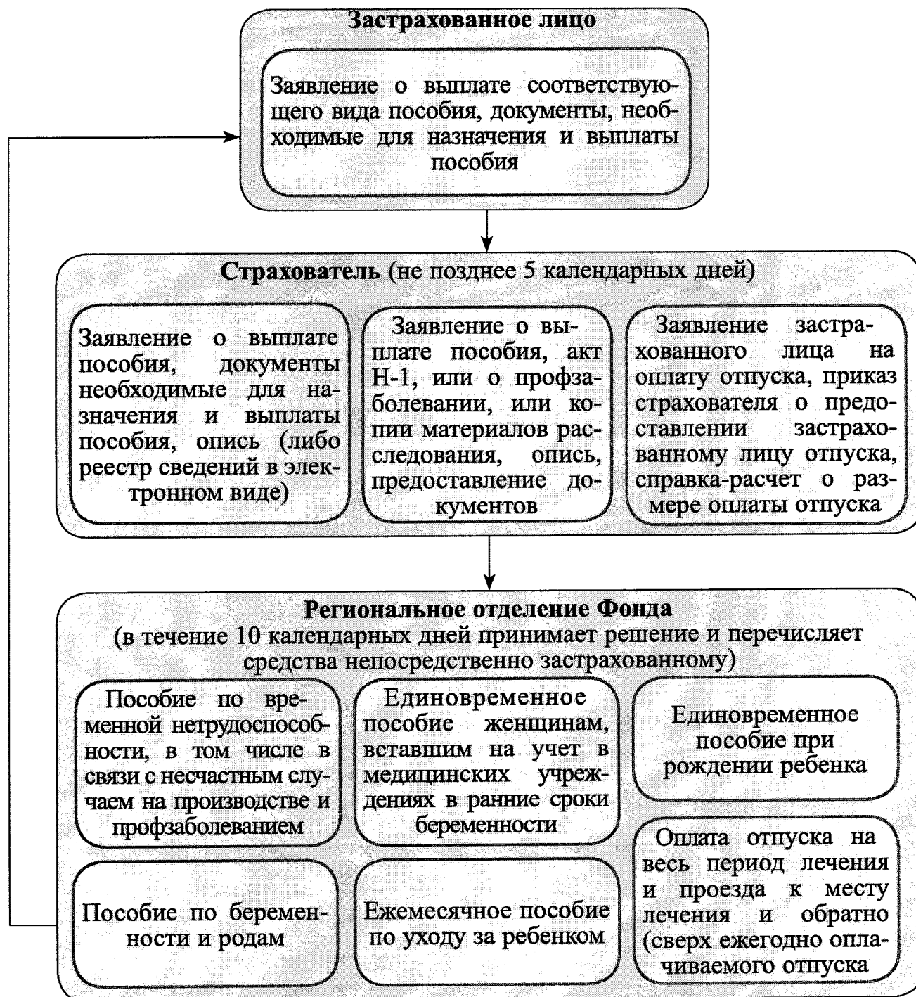
СХЕМА ВЫПЛАТЫ ПОСОБИЙ

Пособие по временной нетрудоспособности в связи с заболеванием, травмой за первые 3 дня временной нетрудоспособности назначается и выплачивается страхователем за счет собственных средств, а начиная с 4 дня временной нетрудоспособности территориальным органом Фонда.